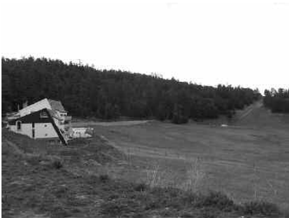
Fig. 5 - La “grenouillère” delle piste di Michlifène, con l'unico albergo della stazione

Il Parco però non intende tutelare solo il notevole patrimonio naturale e paesaggistico dell'altipiano, ma mira anche a salvaguardare e valorizzare le espressioni caratteristiche della cultura materiale delle popolazioni berbere presenti nell'area, come ad