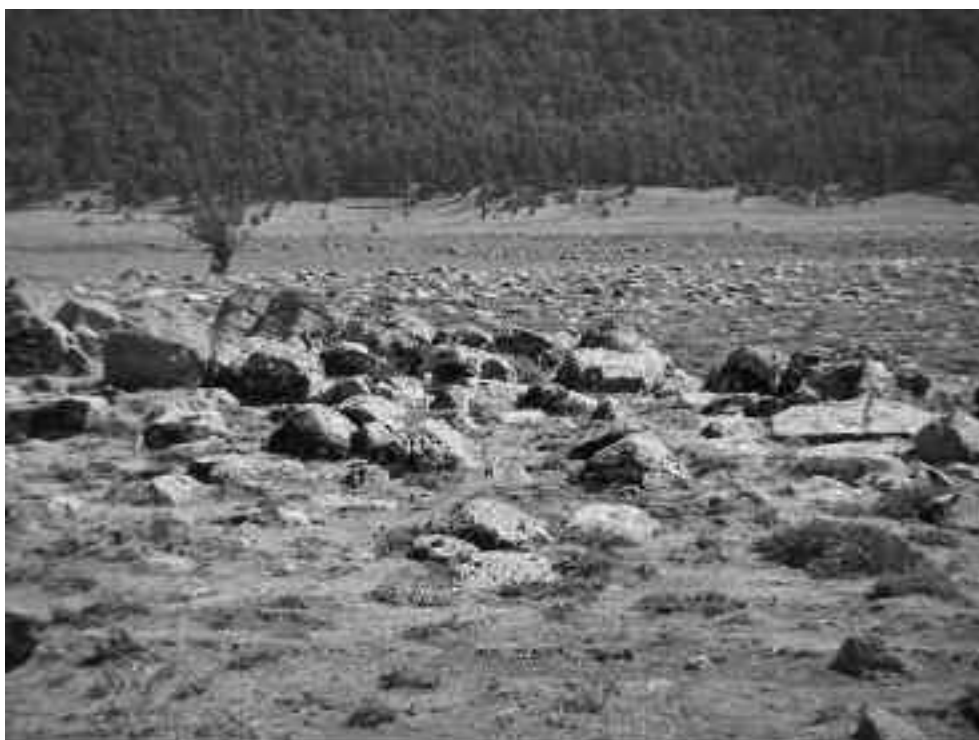
Fig. 3 - Esempio di coperture basaltiche frammiste a depositi limosi quaternari nel bacino del dayet Aoua , sullo sfondo la foresta di cedri

L'attività economica prevalente è però costituita dalla pastorizia (LAUNIA, 2002, pp. 224-226), ed in particolare dall'allevamento ovino 11 . L'entità del patrimonio zootecnico è pressoché impossibile a determinarsi (basti considerare che le stime fornite dall'amministrazione pubblica sono il doppio di quelle fornite dalle associazioni degli allevatori), tuttavia se si accettassero le stime avanzate dall'amministrazione del Parco, si dovrebbe ritenere che esso non sia inferiore ad un milione di capi, con una densità di circa 6 UO/ha/anno, tra le più elevate dell'intero Marocco. Il peso assunto dalla pastorizia lascia impronte notevoli tanto nel paesaggio quanto nella cultura locale. D'estate gruppi di pastori appartenenti ad etnie diverse, non di rado in lotta tra loro per l'uso delle risorse idriche e dei pascoli, conducono le greggi sull'altipiano. Qui durante la stagione del pascolo gruppi di pastori abitano in grandi tende scure (dette kbaiima ), raggruppate attorno