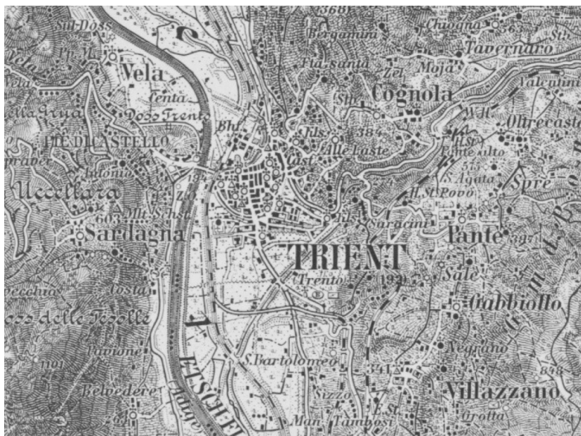
Figura 3. Spezialkarte der Österreichisch-Ungarischen Monarchie 1:75.000, foglio Trient; rappresentazioni non in scala

Per svolgere questo lavoro aveva a disposizione, oltre che un planimeter come supporto di tipo tecnico, mappe dettagliate, con rispettive isoipse di quota, e inoltre le raccolte dei risultati di censimenti che venivano regolarmente pubblicati