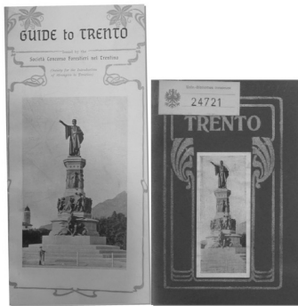
Figura 5. Copertina dell'edizione inglese e italiana della Guida del Trentino (entrambe presso la Biblioteca universitaria di Innsbruck). La foto di copertina mostra, quasi rappresentasse un programma dell'impegno politico di Battisti, il monumento a Dante inaugurato a Trento nel 1896

L'idea di uno stato e della sua espansione territoriale, intesa come intrinsecamente necessaria, come sostenuto da Ratzel, inizialmente trovano poca eco nel lavoro di Battisti, fatto per cui lo stesso Battisti si ritrova in contrasto con i geografi di Firenze. Per la ricostruzione del Trentino, secondo lui, è il fatto stesso che la maggioranza della popolazione sia italiana a rappresentare l'elemento cruciale. Marinelli padre e figlio, invece, basavano le loro richieste teoriche per un confine dell'Italia solidamente fondato sul Brennero sulle opinioni di Ratzel (ROSENBOIM, 2015, p. 25). Non molto più tardi, tuttavia, con lo scoppio della