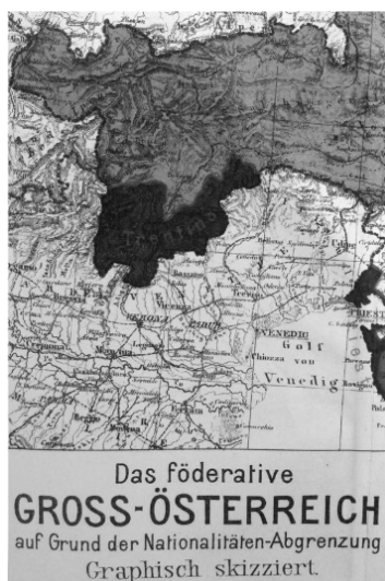
Figura 2. La Federazione Grande-Austriaca. Parte Tirolo (POPOVICI, 1906)

uno spazio limitato, a uno più ampio» (RATZEL, 1897, p. 335, [propria traduzione]) 13 .