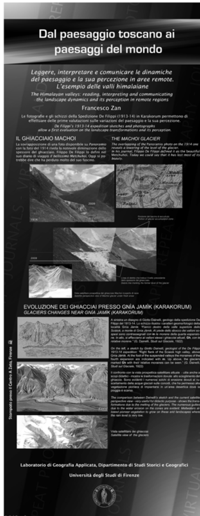
Figura 8. Poster Leggere, interpretare e comunicare le dinamiche del paesaggio e la sua percezione in aree remote. L'esempio delle valli himalayane , facente parte della serie Dal paesaggio toscano ai paesaggi del mondo

In altre occasioni abbiamo chiamato in causa la fotografia per sottolineare alcuni aspetti legati alla toponomastica. Ad esempio, nel convegno Di monti e di acque. Le rughe e i flussi della Terra. Paesaggi, cartografie e modi del discorso geostorico , organizzato dal CISGE a Trento nel 2010, mi sono soffermata sul fatto che alcuni nomi di luogo rappresentano una sorta di fotografia o di ritratto dell'ambiente, frutto di ciò che ha colpito l'attenzione e dato origine al nome. È evidente che,