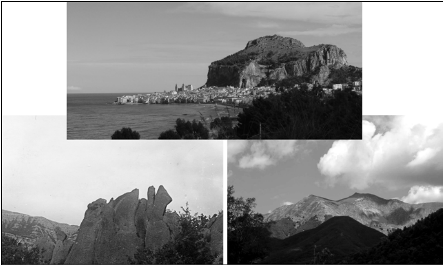
Figura 9. Fotografie e ritratti d’ambiente nei nomi di luogo (Cefalù, La Mano del Diavolo, Monte Libro Aperto)

nonostante la gran parte dei nomi di luogo sia rappresentata da mere constatazioni , toponimi come Monte Libro Aperto, Dente del Gigante, Cefalù, ecc. vanno al di là di un semplice riscontro, perché costituiscono vere e proprie metafore, frutto di un legame particolare con i processi di rappresentazione mentale della realtà. E tanto più interessanti sono questi rapporti se indagati in relazione alle “rughe e ai flussi della Terra”, perché rilievo e acque sono categorie particolarmente rappresentative dell’ambiente e del paesaggio, fondamentali da sempre per l’orientamento, la localizzazione e l’identificazione degli oggetti geografici.