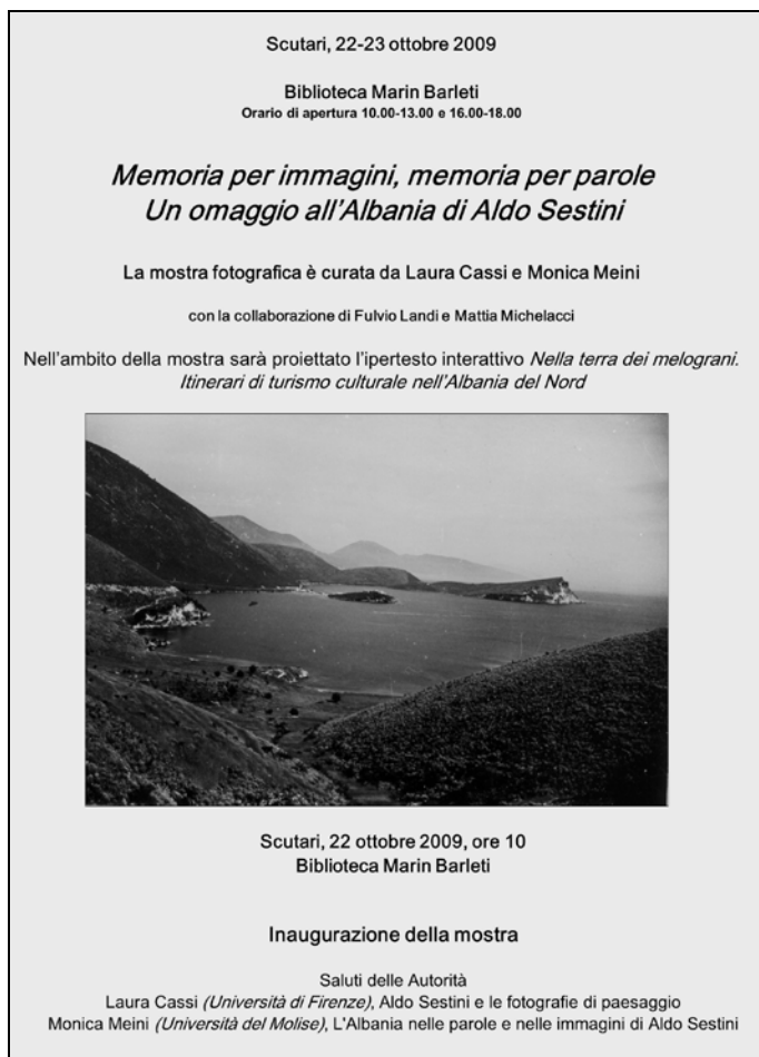
Figura 3. Manifesto della mostra Memoria per immagini memoria per parole. Un omaggio all'Albania di Aldo Sestini (Scutari, Biblioteca Marin Barleti, 22 ottobre 2009)

Nel novembre 2010, a Firenze, nell'ambito di una manifestazione dedicata al tema del paesaggio, organizzata dalla Società Geografica Italiana e dalla Società di Studi Geografici 2 , sono stati realizzati alcuni esempi di repeat photography , suggeriti dalla convinzione che i documenti di ieri offrano un sostanziale contributo allo studio dell'attualità. Le immagini che seguono riproducono alcuni dei poster che furono presentati in tale occasione (figg. 4-8).