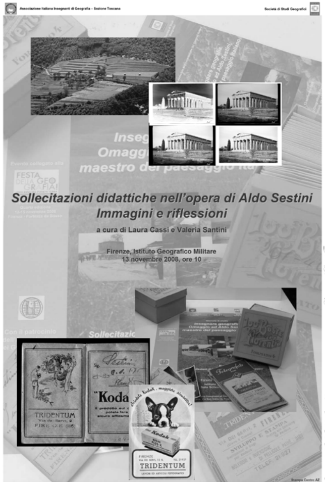
Figura 1. Manifesto della mostra Sollecitazioni didattiche nell'opera di Aldo Sestini. Immagini e riflessioni (Firenze, Istituto Geografico Militare, 13 novembre 2008)

studio e alla rappresentazione di aspetti significativi di realtà territoriali indagate in oltre sessant'anni di intensa attività scientifica. Si tratta di alcune migliaia di pezzi, fra pellicole positive, negative e diapositive, scattate in varie parti del mondo dalla fine degli anni Venti ai primi anni Ottanta del Novecento. La Toscana occupa un posto privilegiato, ma l'Italia tutta e molti paesi europei ed extraeuropei vi figurano rappresentati. Di grande valore documentario sono inoltre i reportage fotografici effettuati in Albania e in Grecia negli anni Quaranta.