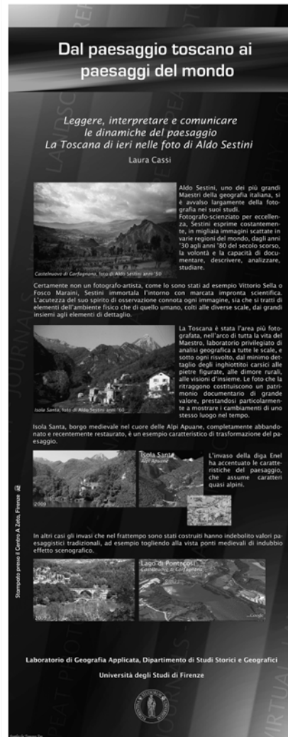
Figure 4-5. Poster Il paesaggio e le sue dinamiche. Illustrazione di casi di studio e Leggere, interpretare e comunicare le dinamiche del paesaggio. La Toscana di ieri nelle foto di Aldo Sestini facente parte della serie Dal paesaggio toscano ai paesaggi del mondo