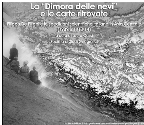
Figura 2. Particolare del manifesto della mostra La "Dimora delle Nevi" e le carte ritrovate. Filippo De Filippi e le spedizioni scientifiche italiane in Asia Centrale 1909 e 1913-14 (Firenze, Palazzo Ammannati, marzo-aprile 2008)

Fu poi la volta del convegno e della mostra dedicati alle carte ritrovate della spedizione scientifica di Filippo De Filippi in Asia centrale, frutto quest'ultima del lavoro di un nutrito gruppo di ricerca costituito da dottorandi e assegnisti operanti nel Laboratorio di Geografia applicata coordinato da Margherita Azzari, sotto la cui guida si era svolto anche il lavoro di archiviazione e catalogazione delle foto della spedizione secondo i criteri dell'Istituto centrale di documentazione. La seconda immagine rappresenta il manifesto della mostra, che fu allestita principalmente avvalendosi dei mezzi scientifici e umani di cui sopra (fig. 2).