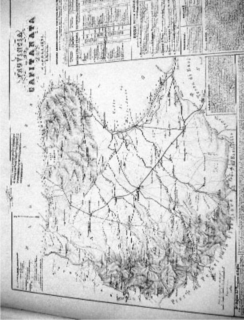
Fig. 1 - B. Marzolla, Provincia di Capitanata 1851, in Descrizione del Regno delle Due Sicilie , 1854.