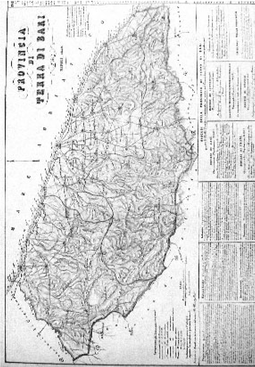
Fig. 2 - B. Marzolla, Provincia di Terra di Bari 1849, in Descrizione del Regno delle Due Sicilie , 1854.