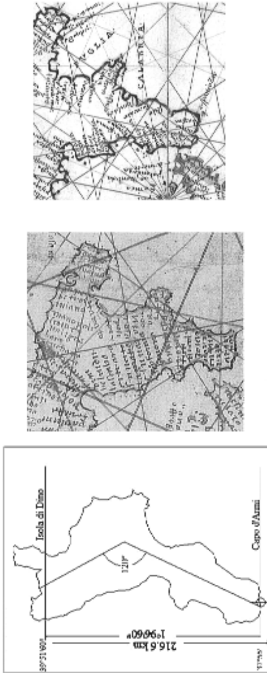
Fig. 1. La Calabria reale, vista da Cola di Briatico (1430) e da B. Agnese (1544).