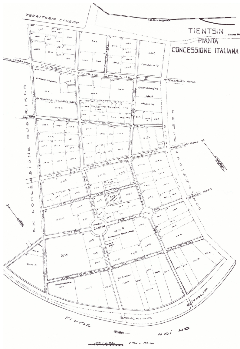
Figura 5. Carta catastale della concessione italiana di Tianjin, ora ultimata, edita in Fileti, 1921

di ciò il fatto che, nel 1930, la carta catastale del 1921 venisse ancora data come ufficiale (Quaglia, 2018b, p. 21, Fig. 5).