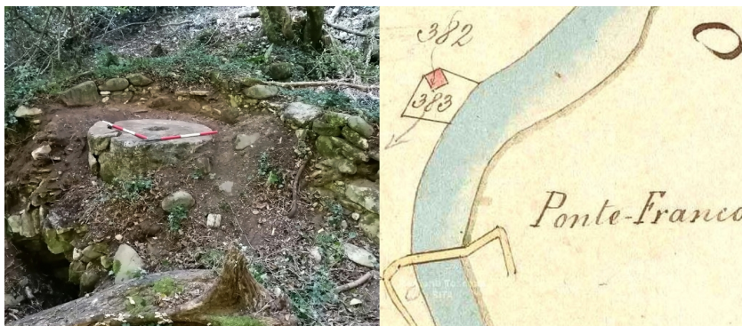
Figura 5. Resti del mulino presso il Ponte Franco, preso da SE (a sinistra); rappresentazione catastale della zona del Ponte Franco, si noti la particella corrispondente al mulino dismesso (A.S.L., Catasto Vecchio , faldone 27 – Bagni di Lucca E, 9, n. 1368) (a destra)

cento, attualmente è conservato soltanto al piano terreno, con muratura in elementi litici spaccati e disposti su filari sub-orizzontali (Ivi, 2021, p. 111). Il secondo, detto mulino «di Rialto», si trova in località Tiglioretta, non lontano dal ponte di Rialto che attraversa il Solco del Rio Grande e del Purioni. L'opificio è composto da un corpo di fabbrica conservato soltanto parzialmente sino al primo piano interrato, ed è realizzato in muratura alla moderna. Risulta dotato di un unico palmento e ritrecine e si possono osservare i resti di quella che era la gora (Ivi, 2021, pp. 112-113).