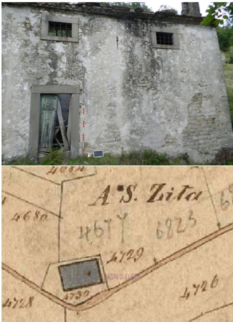
Figura 2. Rappresentazione catastale della chiesa di Santa Zita (A.S.L., Catasto Vecchio , faldone 26 – Bagni di Lucca C2, 28, n. 1339) (in basso); parte terminale della chiesa di Santa Zita, dal cui intonaco emerge una muratura in filari regolari (in alto)

La cartografia storica ha inoltre svolto un ruolo fondamentale nel permettere di individuare la posizione di alcune strutture già note dalle fonti e di cui si poteva ipotizzare l'areale, ma di cui non era nota la