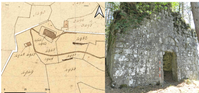
Figura 3. Rappresentazione catastale della chiesa di San Mamerto, si noti la terminazione absidata della struttura (A.S.L., Catasto Vecchio , faldone 28 – Bagni di Lucca P1, 17, n. 1442) (sinistra); muratura della facciata della chiesa di San Mamerto (destra)

contenute nel Catasto borbonico, non avrebbero potuto essere verificate dal gruppo di ricerca, che, senza l'indicazione precisa della collocazione del bene, non avrebbe intrapreso la ricognizione dello stesso.