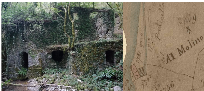
Figura 4. Prospetto SO del cosiddetto mulino «di Sinibaldo» (a sinistra); rappresentazione catastale del mulino (A.S.L., Catasto Vecchio , faldone 27 – Bagni di Lucca E1, 17, n. 1376) (a destra)

Il mulino detto «di Sinibaldo» costituisce un esempio di queste tipologie di strutture idrauliche. Esso si trova sulla riva sinistra del torrente Coccia, nei pressi dell'abitato di Vico Pancellorum, ed è costituito da più corpi di fabbrica, a pianta sub-rettangolare, comprensivi di vasche di adduzione, bottaccio ed una lunga gora di adduzione. Il bottaccio presenta una forma irregolare ed è collegato alle due vasche di adduzione tramite paratie. Si sviluppa almeno su tre piani ed è realizzato in muratura alla moderna; la stessa muratura suggerisce che la struttura abbia subito diversi interventi in età sub-attuale. Al piano terreno sono presenti tre vani voltati con ingresso per canalizzazione sul fondo e sistemazioni almeno per quattro palmenti; sul solaio del primo piano si conserva una doppia macina verosimilmente ancora alloggiata in situ. I perimetrali del piano superiore sono diruti e pericolanti e il prospetto E è in parte crollato (Fig.4). Secondo la bibliografia e le fonti orali, il mulino risale all'età contemporanea (XIX secolo) ed è rimasto in funzione fino al 1957 (Serafini, 2021, pp. 167-168). La ricognizione sul campo ha permesso un confronto diretto tra quanto rappresentato nella cartografia storica e quanto conservato della struttura, trovando un riscontro preciso e fedele.