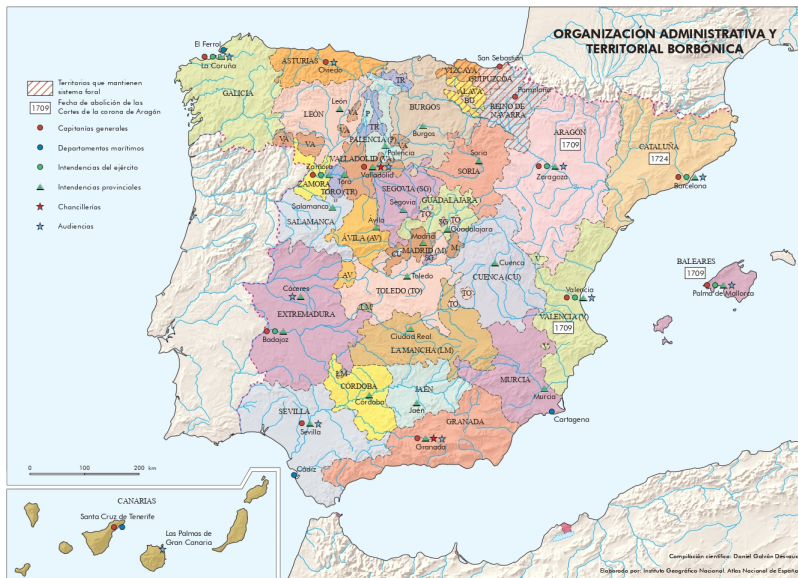
Figura 1. Mapa de la distribución provincial de la Corona de Castilla, 1749.

y el corto periodo de tiempo que llevó realizarlo (1750-1759) (Fig. 1). En él bordamos la compleja y controvertida problemática de conocer los recursos económicos totales que debió aprontar la Real Hacienda para realizar la magna pesquisa de los territorios y gentes castellanos, qué metodología de averiguación se estableció, en qué tareas y cómo se gastaron esos dineros y algunos de los factores geográficos, sociales, económicos, técnicos, etc. que incidieron en los mismos.